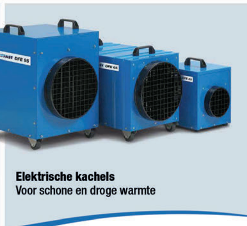
Elektrische kachels Voor schone en droge warmte