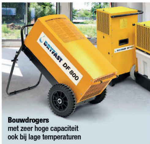
Bouwdrogers met zeer hoge capaciteit ook bij lage temperaturen