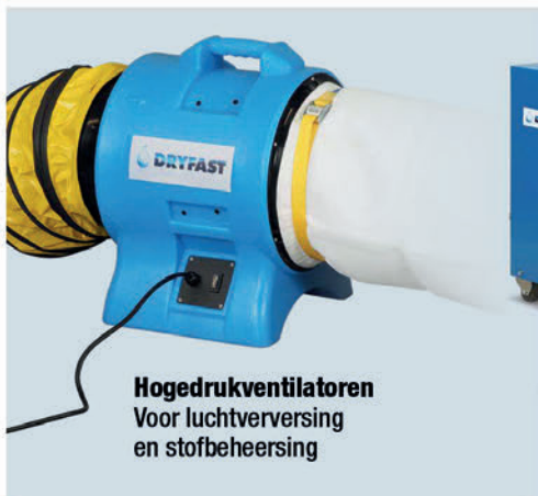
Hogedrukventilatoren Voor luchtverversing en stofbeheersing