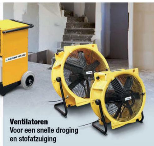
Ventilatoren Voor een snelle droging en stofafzuiging